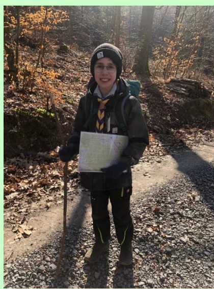
Vor dem Berg: