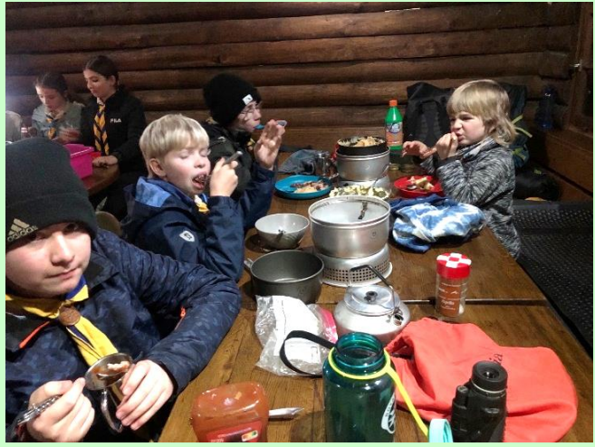
Dann abwaschen! Da hinten sitzt er – der Proviantwart! Danke!